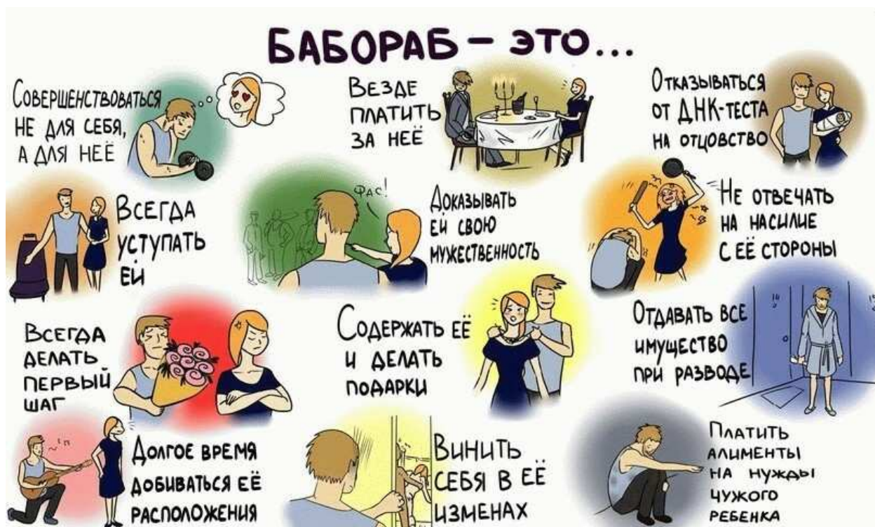
Рисунок из просторов интернета