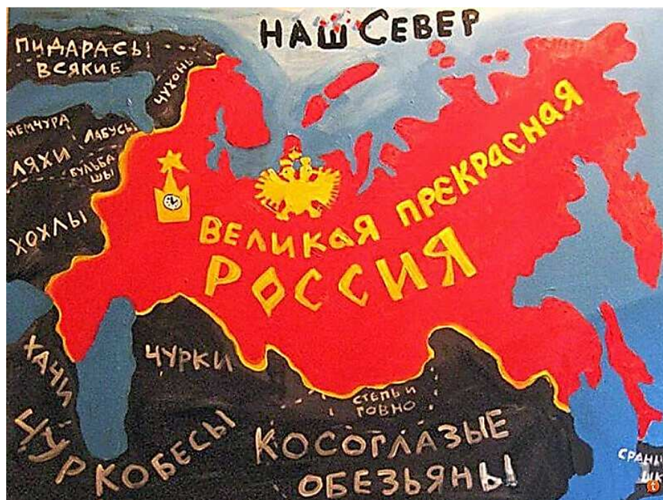
Рисунок из просторов интернета

На биороботов нажим. С красивых «тачек» Землю пучит. Наевшись бургеров, лежим. Нас ничему злой век не учит!