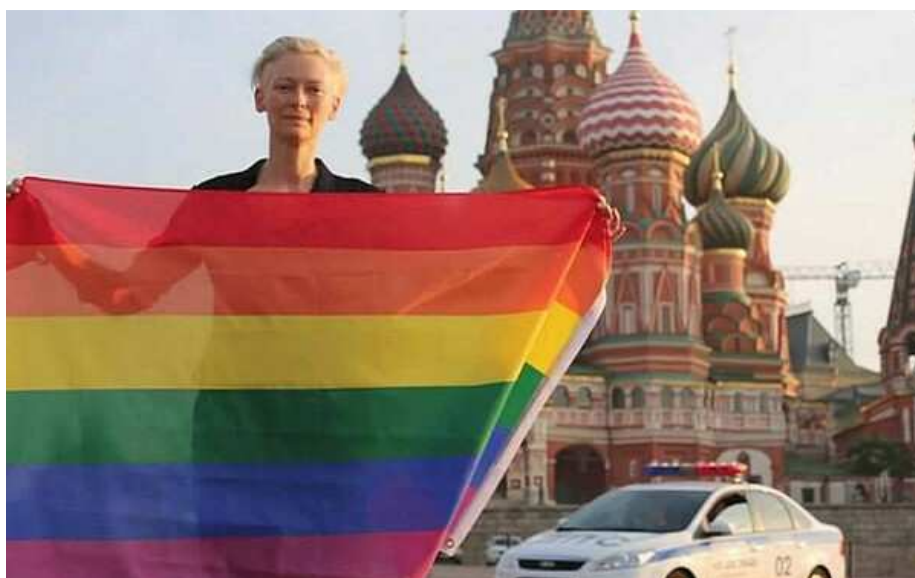
Рисунок из просторов интернета