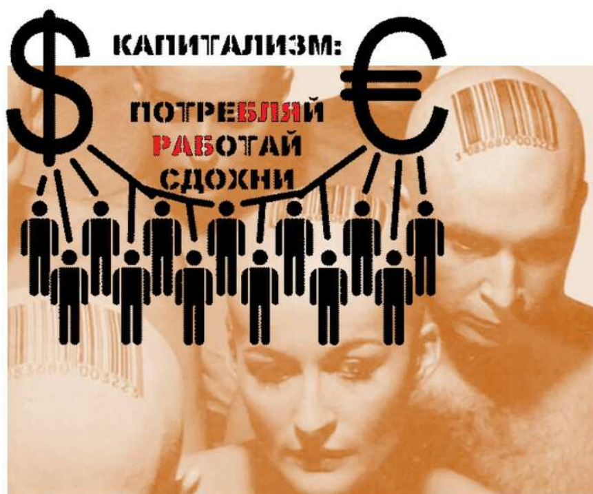
Иллюстрация собрана по рисункам из Интернета

Работай и трудись, Ползи улиткой ввысь. Ответь на сей вопрос – ТЫ – ЛИЧНОСТЬ ИЛЬ ОТБРОС??? Расслабишься – в рот кляп. Глядишь... и бабоРАБ. А время – кап, да кап... Пойми, что ты – лишь раб!!!