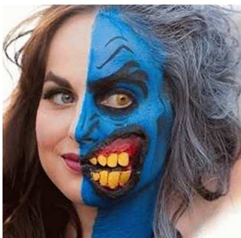
Рисунок из просторов интернета

Девушка-страшила, Третий уж аборт. «Красота» не сила В ней, а – глупый ход.