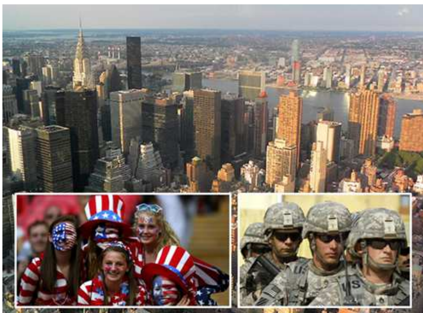
Фото-сборка из просторов интернета

На Луну мы тоже не летали, Нé был никогда там Амстронг Нил. В мире прожектёрством промышляли – Розуэл вас классно покорил. Сами по себе. И лишь попробуй Что-то нашей воле возразить – Силы пентагона, как микробы, Будут твою Родину душить. Так что, соглашайся на контракты С нами, хоть и выгоды чутóк. Ежели откажешься – теракты Могут потрясти весь твой мирок. МЫ! И к нам текут умы планеты! Скоро мы захватим целый мир; Первые страницы у газеты, Теле-радио-инет эфир.